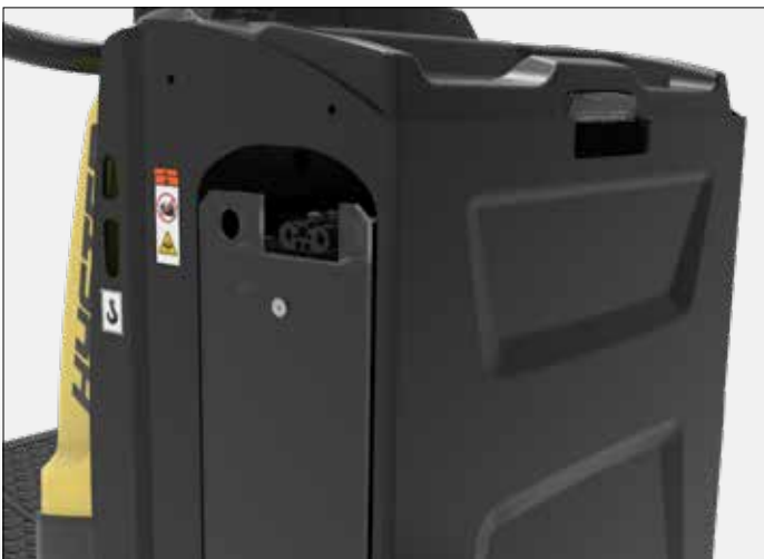
LITHIUMIONBATTERIJ OPLADEN AAN ZIJKANT

LITHIUMIONBATTERIJEN ZIJN EFFICIËNTER, OP MEERDERE MANIEREN.