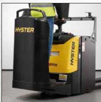
VASTE ACHTERBESCHERMING MET TOEGANG AAN DE ZIJKANT