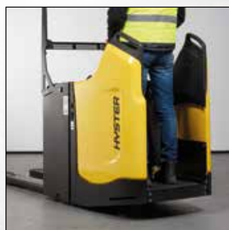
VASTE ZIJBESCHERMING MET TOEGANG AAN DE ACHTERKANT