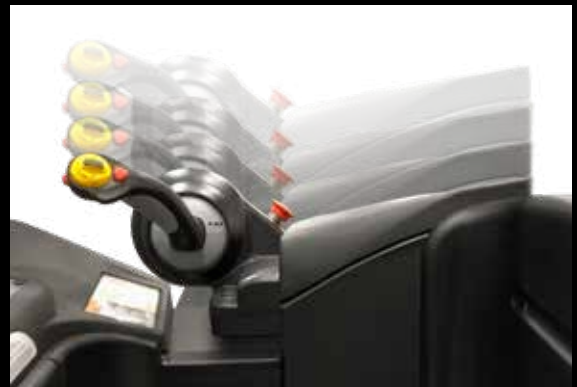
El reposabrazos ajustable con 3 pulgadas de ajuste hacia delante y hacia atrás y 6 pulgadas de ajuste de altura se adapta a operadores de cualquier tamaño.