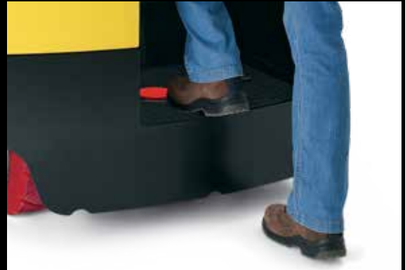
Conveniente altura de los escalones